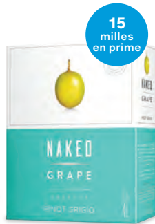
PINOT GRIGIO NAKED GRAPE (CARTON-OUTRE) 4 000 mL | 41,95 $ 432724