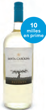
SAUVIGNON BLANC RESERVA SANTA CAROLINA 1 500 mL | 21,95 $ 278127