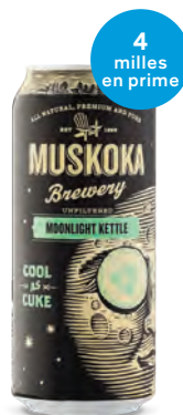
MUSKOKA COOL AS A CUKE 4 x 473 mL | 12,95 $ 553958