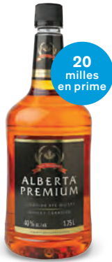
WHISKY ALBERTA PREMIUM 1 750 mL | 60 $ 54213

VOUS ORGANISEZ UNE FÊTE ESTIVALE? Obtenez des milles Air Miles md en prime à l'achat de ces classiques populaires.