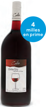
COLIO ROUGE EXTRA SEC 1 500 mL | 14,95 $ 85464

ENVIE DE NOUVELLES BIÈRES POUR GARNIR LA GLACIÈRE? Obtenez des milles en prime à l'achat de ces bières savoureuses.