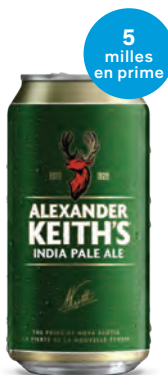
ALEXANDER KEITH'S IPA 6 X 473 mL | 15,75 $ 442582

ENVIE DE NOUVELLES BIÈRES POUR GARNIR LA GLACIÈRE? Obtenez des milles en prime à l'achat de ces bières savoureuses.