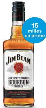
BOURBON JIM BEAM WHITE LABEL 1 140 mL | 40,10 $ 217786