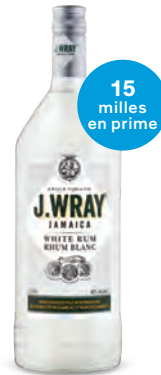
RHUM BLANC J. WRAY WHITE 1 140 mL | 40,10 $ 258335