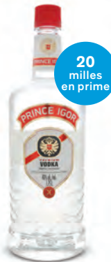
VODKA PRINCE IGOR 1 750 mL | 60 $ 190363