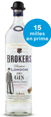
LONDON DRY GIN BROKER'S PREMIUM 1 140 mL | 40,55 $ 494047

VOUS INVITEZ LES AMIS À REGARDER LE MATCH À LA TÉLÉ? Simplifiez-vous la vie avec ces vins en format réception.