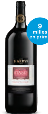
SHIRAZ/CABERNET SAUVIGNON STAMP SERIES HARDYS 1 500 mL | 18,95 $ 695080