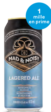
CREEMORE SPRINGS MAD & NOISY LAGERED ALL 473 mL | 3,10 $ 512947