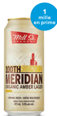
MILL ST. BREWERY 100TH MERIDIAN ORGANIC AMBER LAGER 473 mL | 3,15 $ 413765