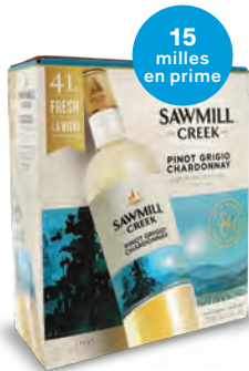
PINOT GRIGIO/ CHARDONNAY SAWMILL CREEK (CARTON-OUTRE) 4 000 mL | 40,95 $ 247007

VOUS INVITEZ LES AMIS À REGARDER LE MATCH À LA TÉLÉ? Simplifiez-vous la vie avec ces vins en format réception.