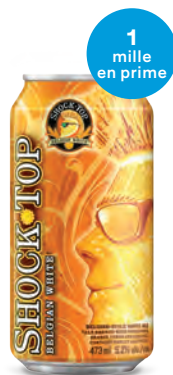
SHOCK TOP (BLANCHE BELGE) 473 mL | 2,80 $ 306944